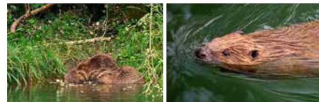
Les castors d'Orbe ont eu des petits en 2017

La nature est très présente sous et autour du moulin, poissons, oiseaux d'eau, castors, éponges d'eau douce, moules zébrées, etc. Des films documentaires les présentent et une caméra sous-marine permet de les visionner « en direct ».