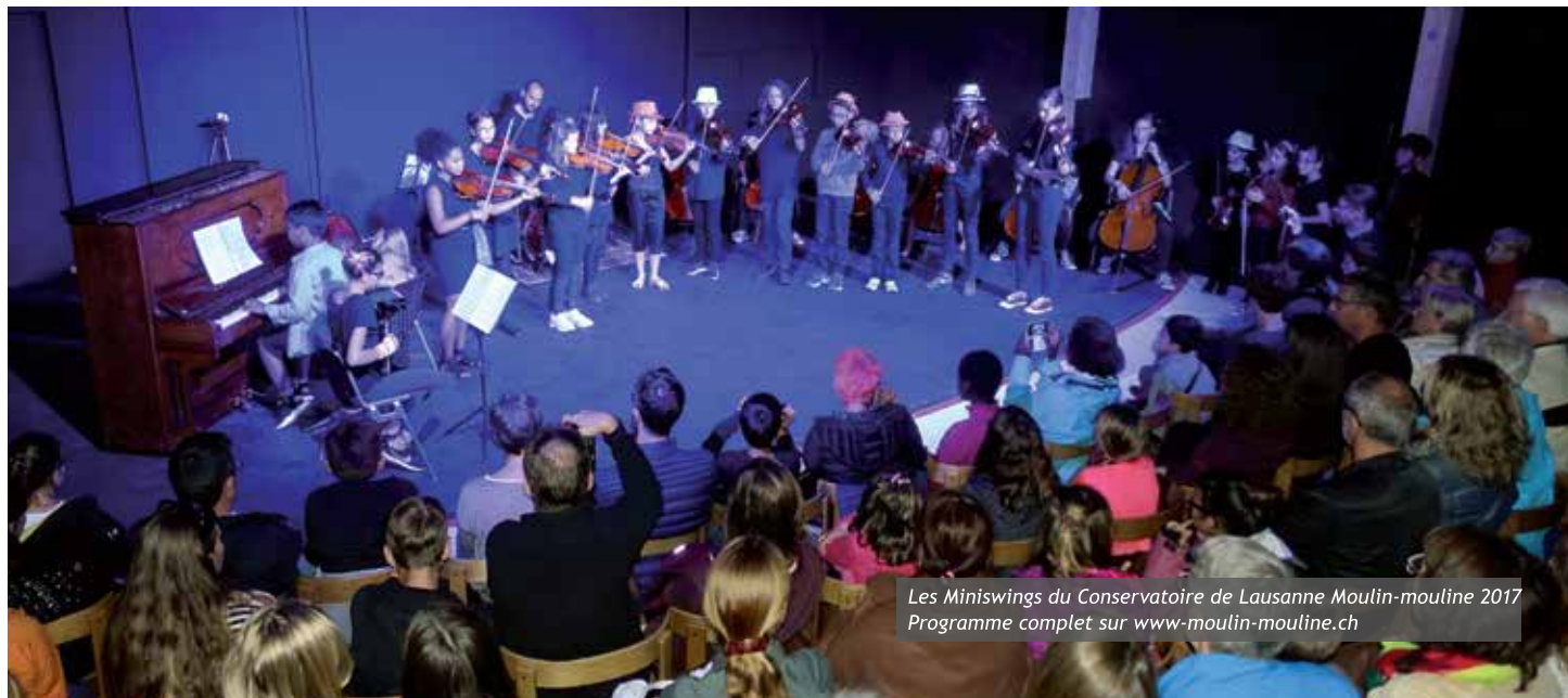
Les Miniswings du Conservatoire de Lausanne Moulin-mouline 2017 Programme complet sur www.moulin-mouline.ch