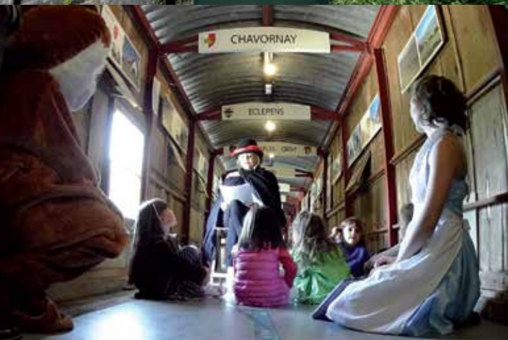
Parcours-spectacle dans la passerelle de 1898