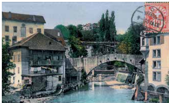
Au premier plan, le plus vieux pont de pierre de Suisse encore en activité