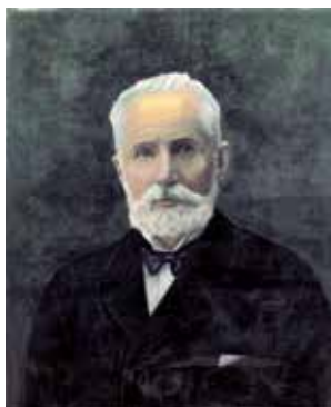
Jules Rod, fondateur des moulins Rod en 1871

Notre association a réhabilité le bâtiment de près de 3000m 2 pour le faire découvrir au public et présenter des expositions, animations et projections d'anciens films qui permettent de mieux appréhender le site et son histoire.