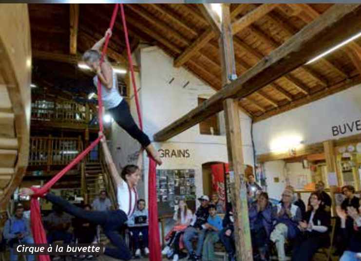
Cirque à la buvette