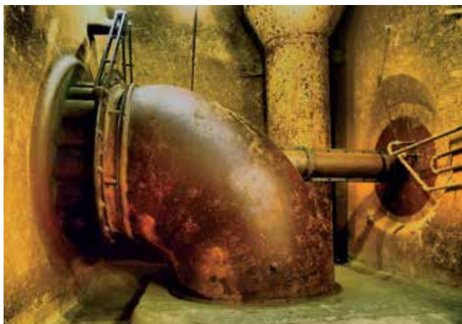
Le site abrite la plus ancienne centrale électrique sur l'Orbe (1891)

techniques et industriels, fermant définitivement à la fin des années 1990. Aujourd'hui, les traces de ces activités sont encore visibles dans les bâtiments existants.