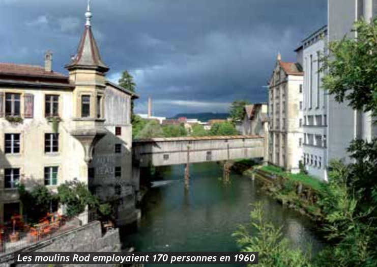
Les moulins Rod employaient 170 personnes en 1960