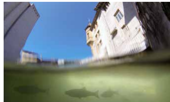
Les poissons apprécient les caches sous l'ancien moulin

L'Orbe est une rivière qui illustre à elle seule l'histoire de l'énergie hydraulique. Les moulins Rod contiennent trois anciennes turbines qui produisaient 2 millions de kWh par année. Ces installations peuvent être visitées. Légèrement en amont, se trouve le Pont du Moulinet, le plus vieux pont de pierre de Suisse, que fit construire entre 1421 et 1424 un pieux ermite entre deux solides rochers ; au-dessus, se situe l'abbaye qui accueillit le premier établissement orthopédique du monde, créé par Jean-André Venel en 1780.